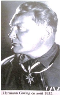
Hermann Göring en août 1932.