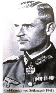
Carl-Heinrich von Stulpnagel (1941)

Ces visiteurs sont très protégés par leurs soldats SS et les conditions de l'action résistante n'en sont que plus difficiles.